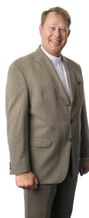
Matz Ansvarig Förvaltare