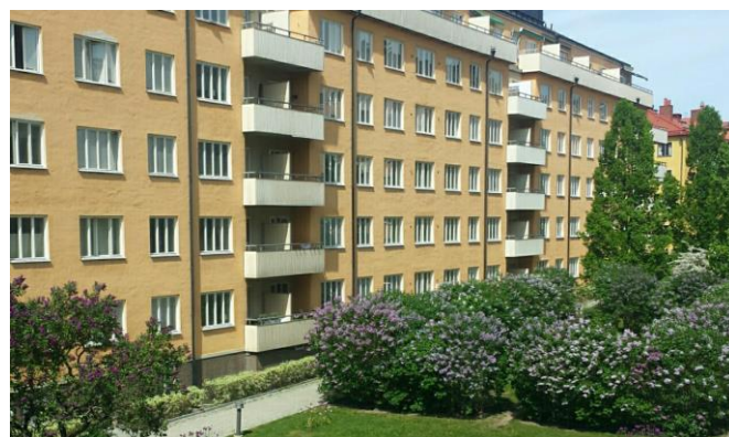
Mässens "Stora gård" med syrerterna i full blom